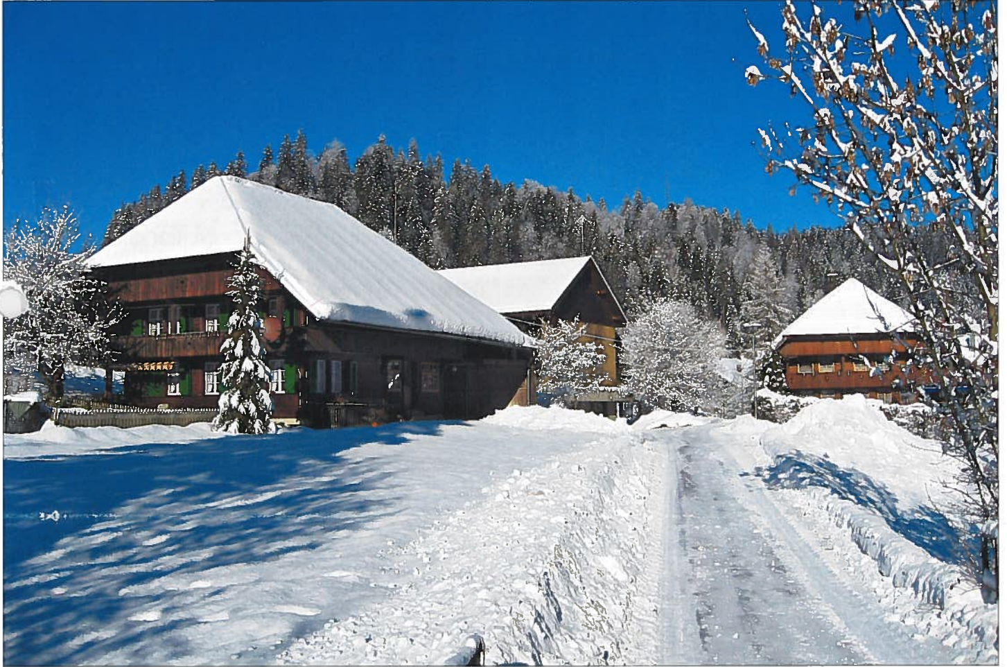
Rötthbach, Schächli