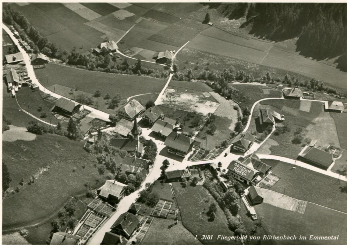
Abb. 1: Luftbild «Alpar» Bern. Ungelaufen. Ausgabejahr unbekannt.