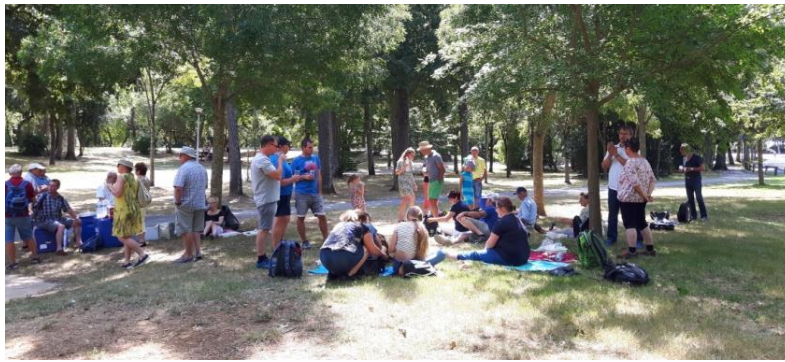
Picknick in la Rochelle