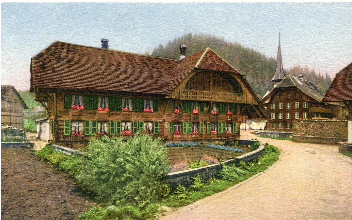
Abb. 2: Gasthof zum Rössli, Fam. W. Stucki, Tel. No. 1!