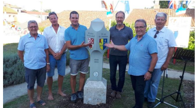
aktuelle und ehemalige Bürgermeister und maires (sculpteur sans souliers )

Verantwortlich für diesen Beitrag: Ruedi Megert