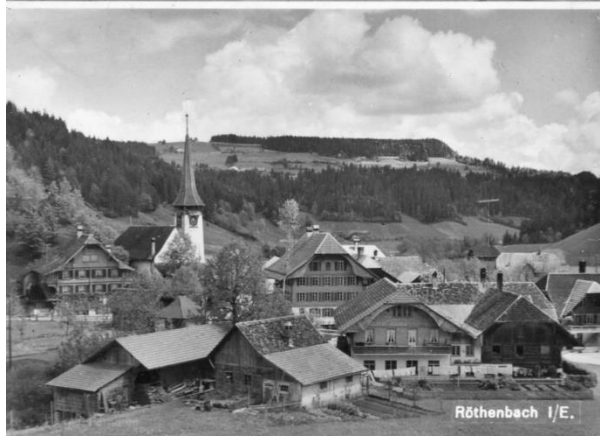
Röthebach i. E.