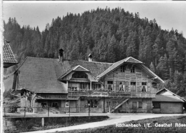
Röthebach i. E. Gasthof Rössli