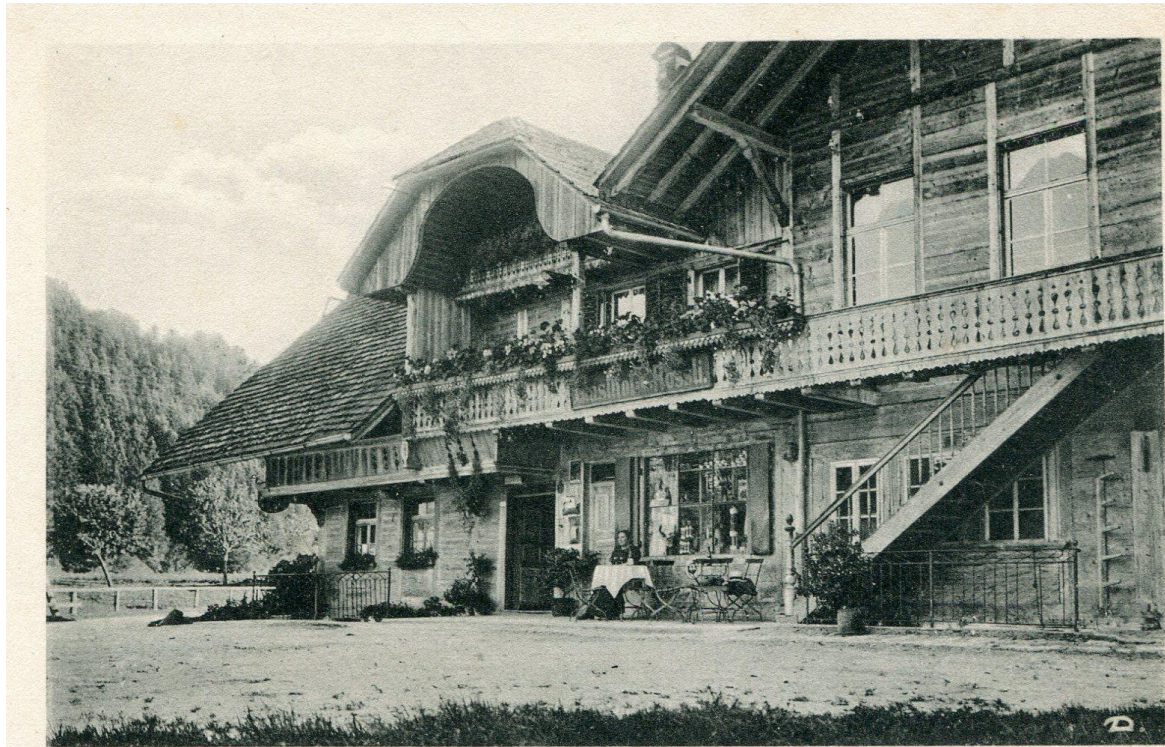
Gasthof zum Rössli — Röthebach i. E.