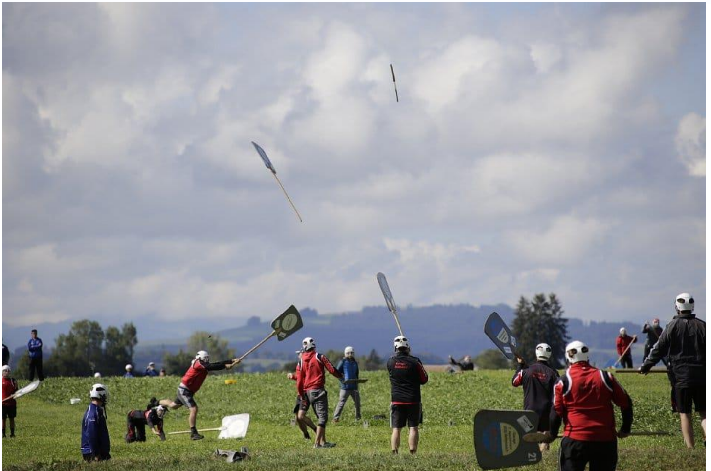
Hornussgesellschaft Röthenbach i. E.