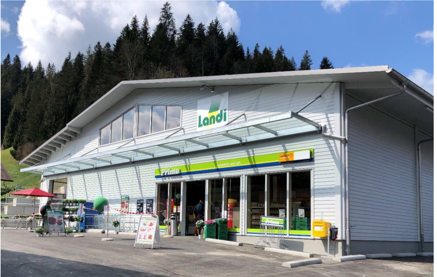
Am 22. April 2021 wurde der LANDI-Prima Laden in Röttenbach i. E. eröffnet.