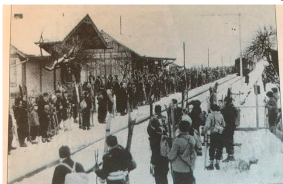
Skifahrer warten in Bowil auf den Zug Richtung Bern. Die Aufnahme stammt aus der Zeit um den Zweiten Weltkrieg.